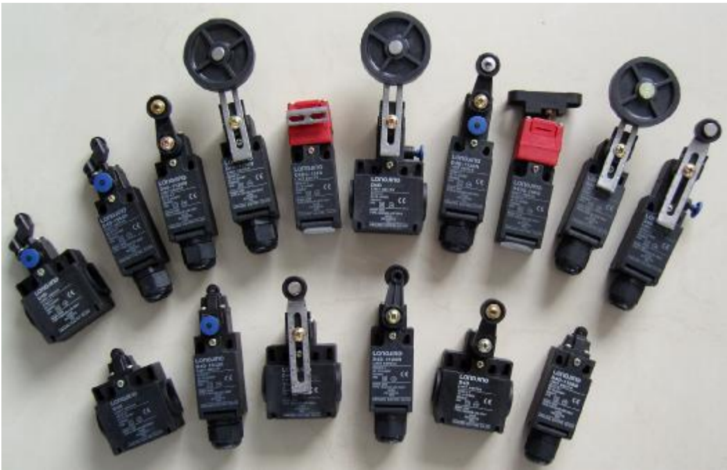
龙井电器的行程开关系列在业内享有很高的品质声誉

浙江龙井电器有限公司的价格调整方案已于 2008 年 2 月 1 日开始实施,公司总经理负责人表示,市场讲究的是一份价格一分货,这一次的价格调整,使得公司的整体价格体系更趋合理与科学,龙井也将一如既往地以高质量的产品和优质服务全力支持国内外客户的发展。他强调,关于此次龙井产品调价,客户如有任何疑问,可随时致电龙井各销售部。